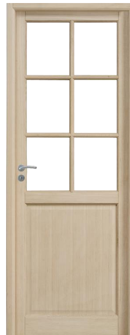
PYRITE à vitrer