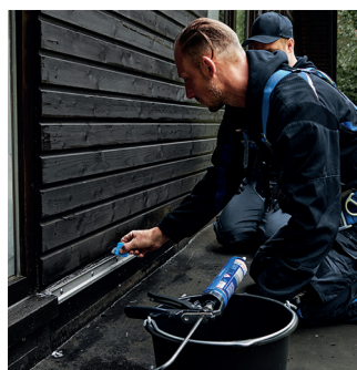
Poche 400 ml