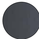
Satin Dark Grey